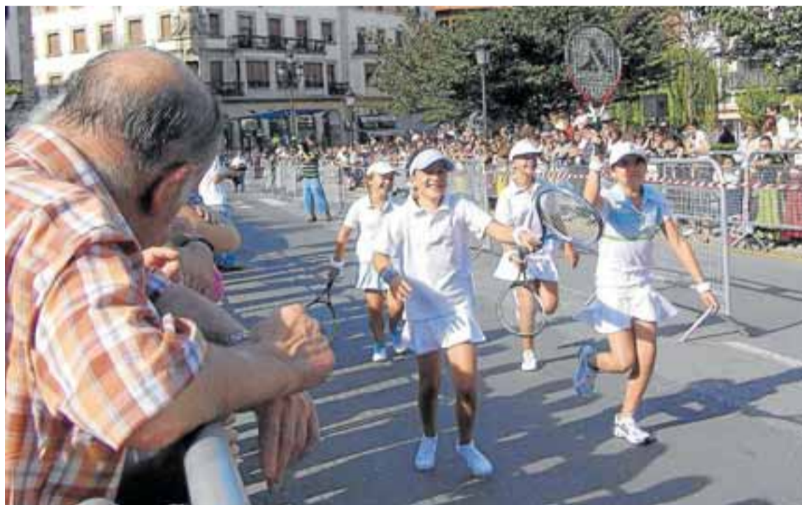
San Roketxu es la jornada idónea para que las cuadrillas presenten sus disfraces.

San Roketxu y San Roketxutxu, por último, serán las dos jornadas de cierre de unos Andramaris para para entonces ya estarán más que lanzados. No en vano, del programa de primer día -17 de agosto- destaca el desfile de disfraces que teñirá de colorido y buen humor la céntrica calle Juan Calzada a las 18.30 horas. La elektrotzaranga Burrumba, un espectáculo de teatro callejero y el toro de fuego servirán para que el ambiente no decaiga. La última jornada estará capitalizada por los más pequeños, que por la mañana tendrán fiesta de la espuma y cerrarán el Umeen Txokoa de la plaza del Mercado por la tarde. Los más mayores, por su parte, podrán participar en los campeonatos de mus y brisca. ●