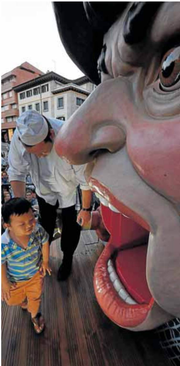
Recuperado en 2017, el Gargantua estará presente en las fiestas.

Más de un centenar de actos conforman unas fiestas gernikarras que conjugan tradición con vanguardia, y que cuentan con la música, los actos infantiles, la gastronomía y el deporte como sus principales alicientes.