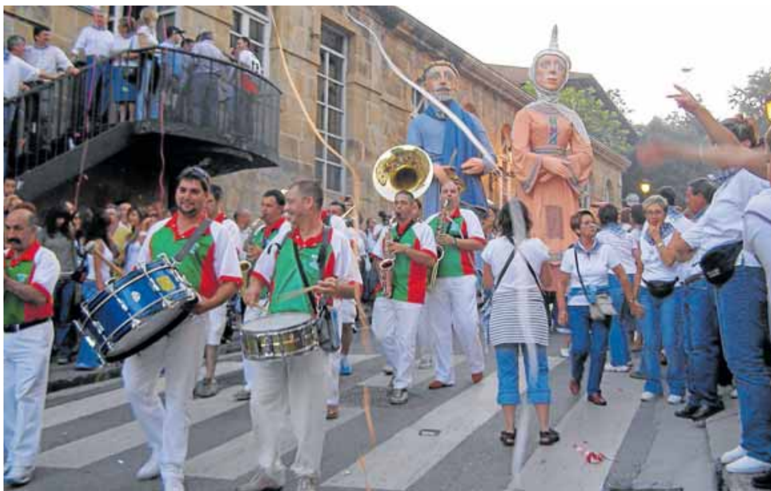
Las cuadrillas tomarán la cuesta del Pasealeku para el txupinazo.

de Oihan Vega en San Juan Ibarra y Tooth y The Real Mackenzies en el escenario del Pasealeku.