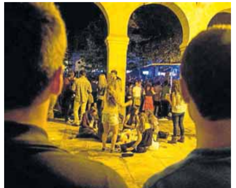
Jóvenes en la zona del Pasealeku.

La Policía Municipal también vigilará muy de cerca la seguridad. De hecho, ha lanzado diferentes recomendaciones incluidas en el programa festivo para que, "sin caer en el alarmismo, ayuden a que las fiestas sean más seguras". Robos o hurtos suelen ser los problemas más habituales en fiestas, por lo que Udaltzaingoa insta a extremar las precauciones para evitar problemas en las zonas de mayores aglomeraciones, que son los conciertos, las barracas o las txosnas. "Si observamos un hecho delictivo, lo pondremos en conocimiento de la Udaltzaingoa, la Ertzaintza o del 112",