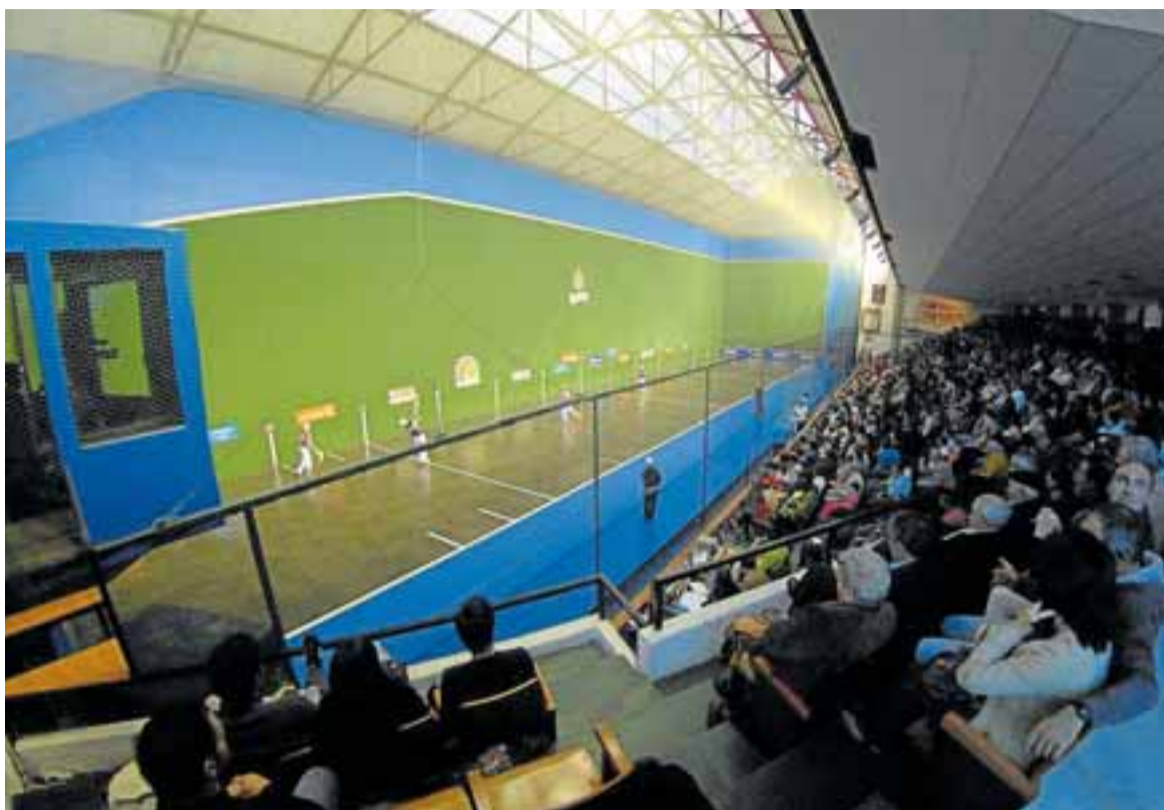
Final Mundial de cesta punta por parejas celebrada en la Universidad Markina.