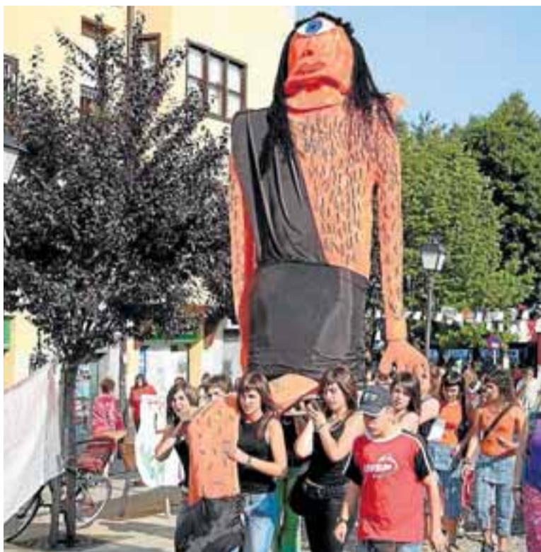
Alarabi recorrerá mañana las calles de la localidad.

Según lo describe José Miguel de Barandiaran en su Diccionario de Mitología Vasca, con este nombre