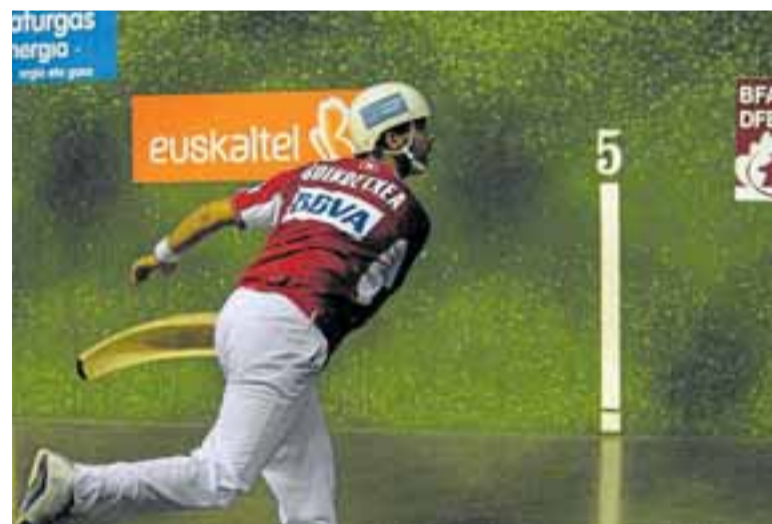
El frontón es conocido como la Universidad de la Pelota.

son Andrinua, Mugerza I, Careaga I, Orbea I y Bengoa, entre otros muchos, y ya en tiempos más recientes tenemos los casos de Elorza, Atain, Iru, Recalde y Urkidi.