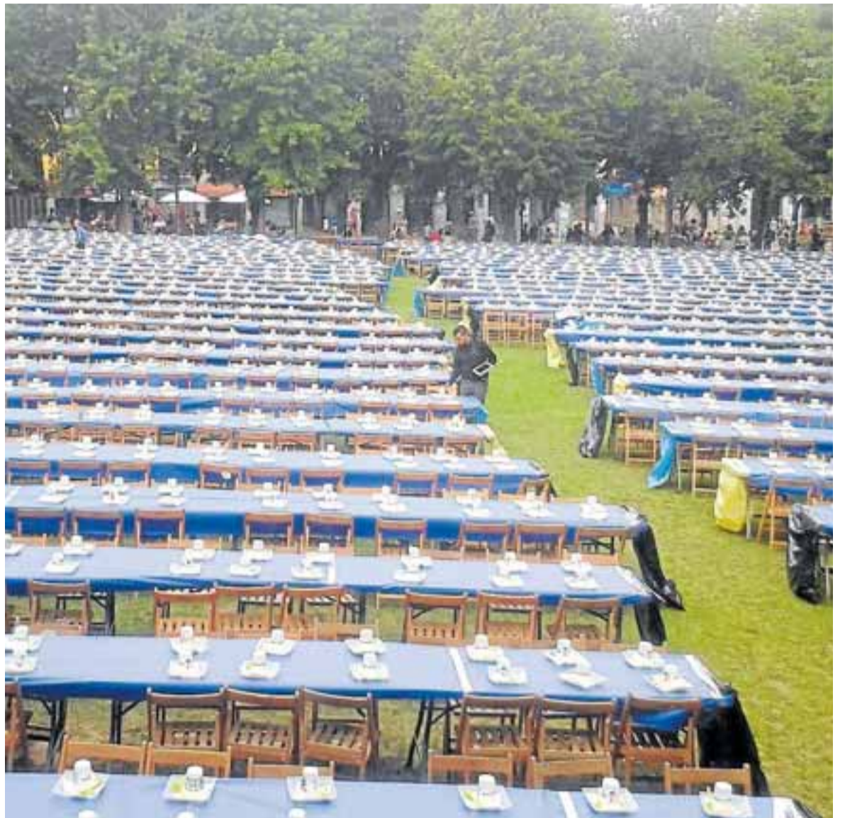
Las estampa sorprende por la cantidad de comensales que participan en la comida.

Cada cuadrilla, ataviada con su propia indumentaria de fiestas, prepara su paella para luego sentarse todas juntas en torno a las mesas previamente instaladas en