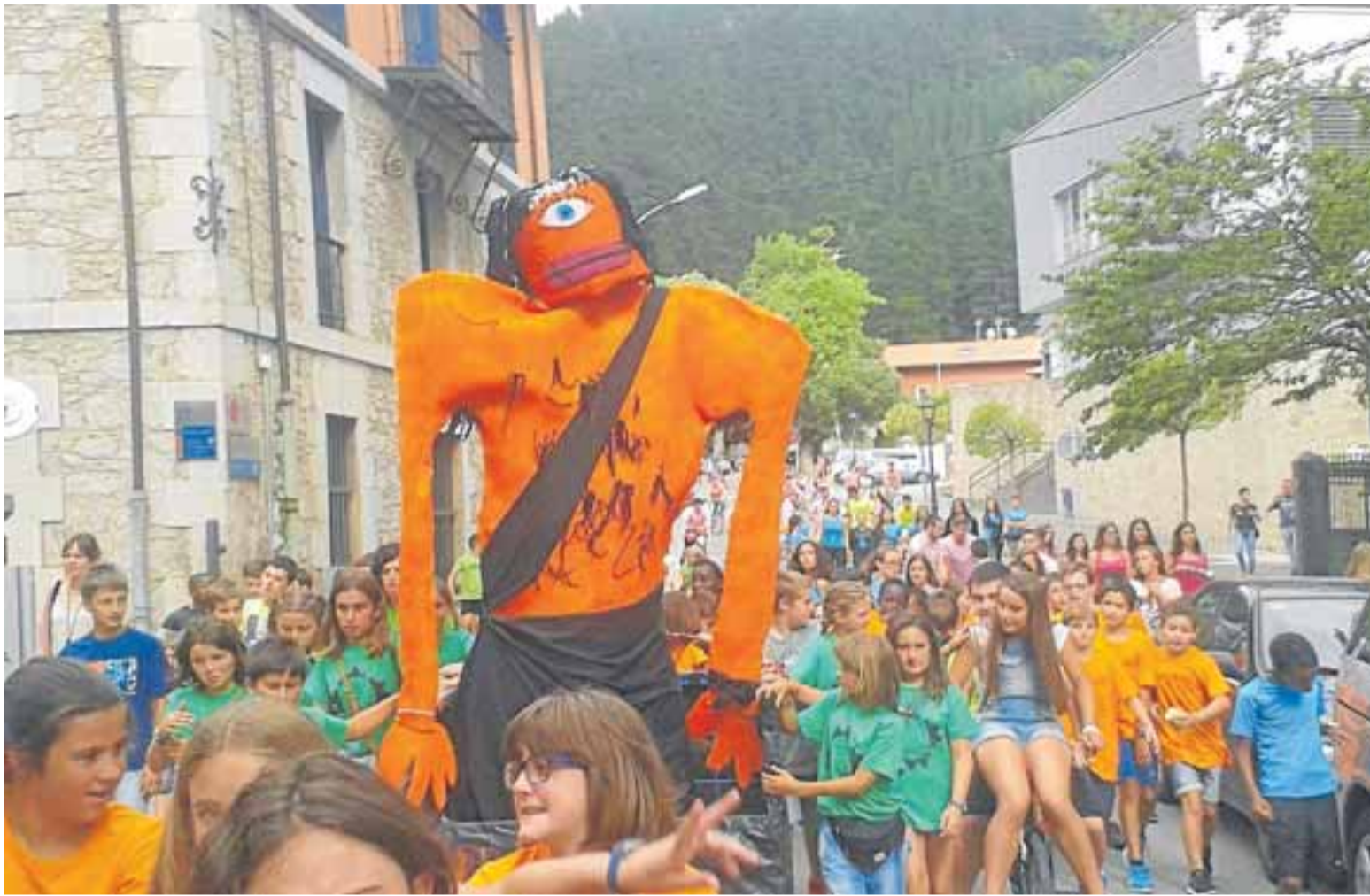
Aurten ere, Alarabi jaietako maskota herriko kaleetan zehar ibiliko da.

KONTZERTU ITZELAK Beste urte batez, Jai Batzordeak berebiziko garrantzia eman dio musika egitarau indartsua prestatzeari. Zentzu horretan, Azalera, Vendetta eta ZOO taldeen eskutik izango dira musika emanaldiak.