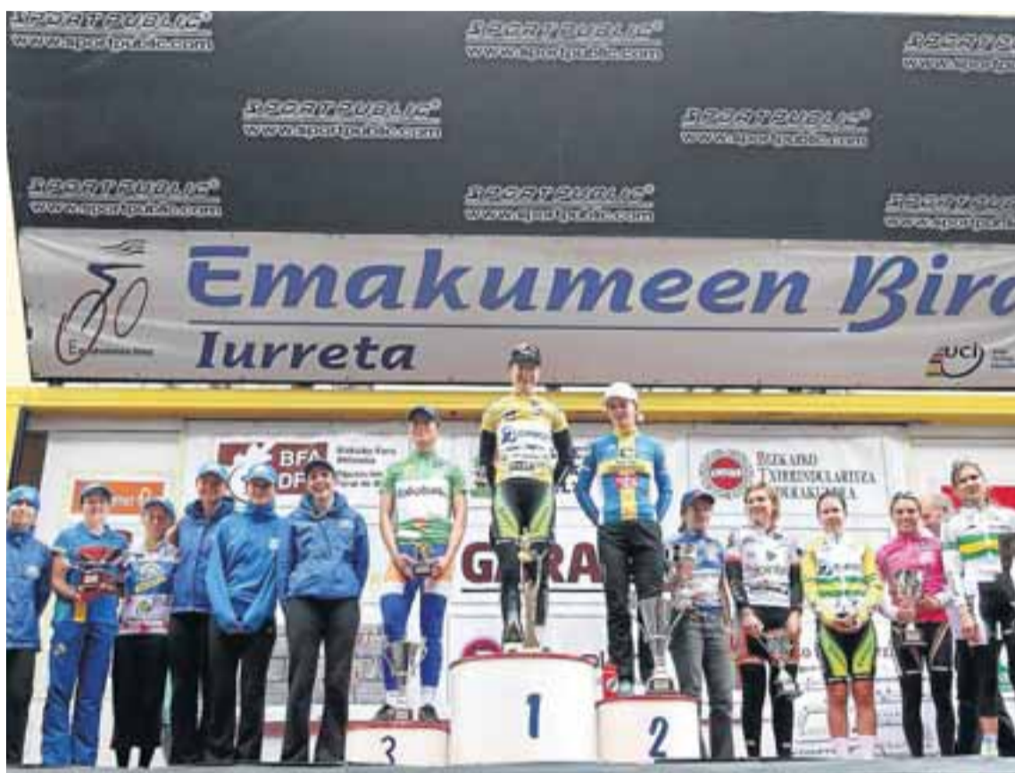
Podio de una de las ediciones de la Emakumeen Bira.

La Emakumeen Bira sitúa a Iurreta en el mapa mundial del ciclismo