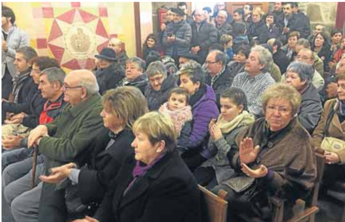
Entre la foto superior e inferior han transcurrido 25 años.