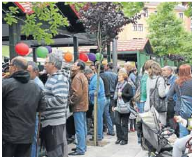
La feria de la carne y el vino aglutina a los iurretarras.

“La verdad es que se realizó una transición bastante normal. Los vecinos estaban deseosos”, cuentan desde la empresa, aunque reconocen que “hubo algunas guerrillas”. En esta línea recuerdan que se generaron algunos problemas con el pago de impuestos por un permiso que se había pedido para realizar unos trabajos de mejora en la planta. “Íbamos a hacer las