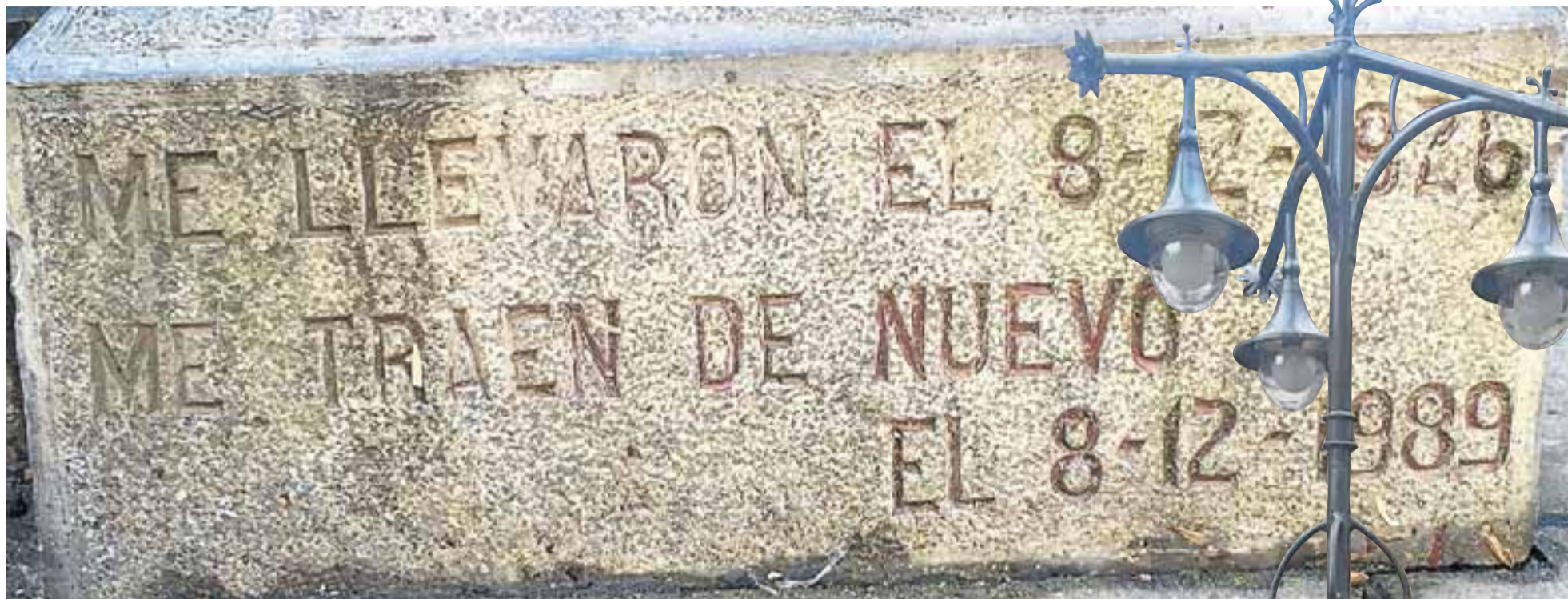
Parte inferior de la fuente donde pueden leerse las fechas en las que fue trasladada de Iurreta a Durango y el camino de vuelta.

Un pueblo se construye con el trabajo de sus vecinos pero siempre hay elementos que recuerdan cuál fue el pasado. Símbolos que con el conocimiento de la Historia adquieren un significado más profundo, que reviven los acontecimientos con sólo admirarlos. Retazos de lo que fue el pasado para que las nuevas generaciones no olviden qué sucedió, por qué y cuándo pasó. Uno de los ejemplos más claros es la fuente que hoy en día se ubica junto a la iglesia Santa María de Durango y que durante décadas se instaló en la plaza de Iurreta. Quién más y quién menos en Durangaldea sabe que se esconde tras este elemento de hierro, que abasteció de agua a miles de personas durante años.