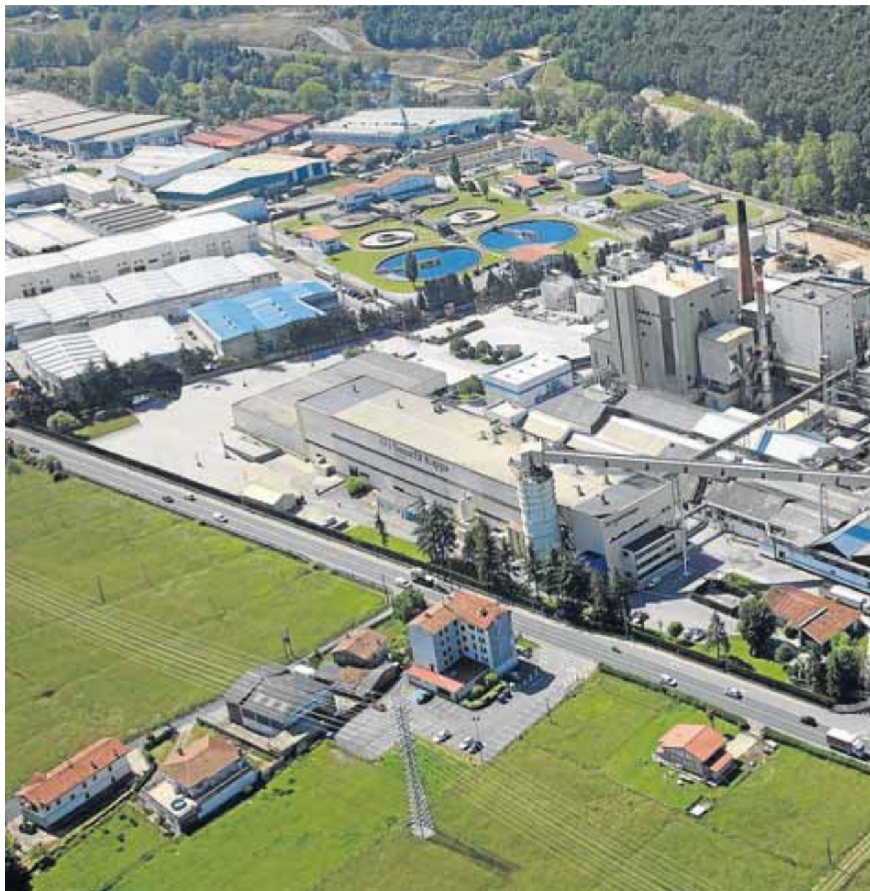
La empresa Smurfit Kappa Nervión pasó de pertenecer de Durango a Iurreta.