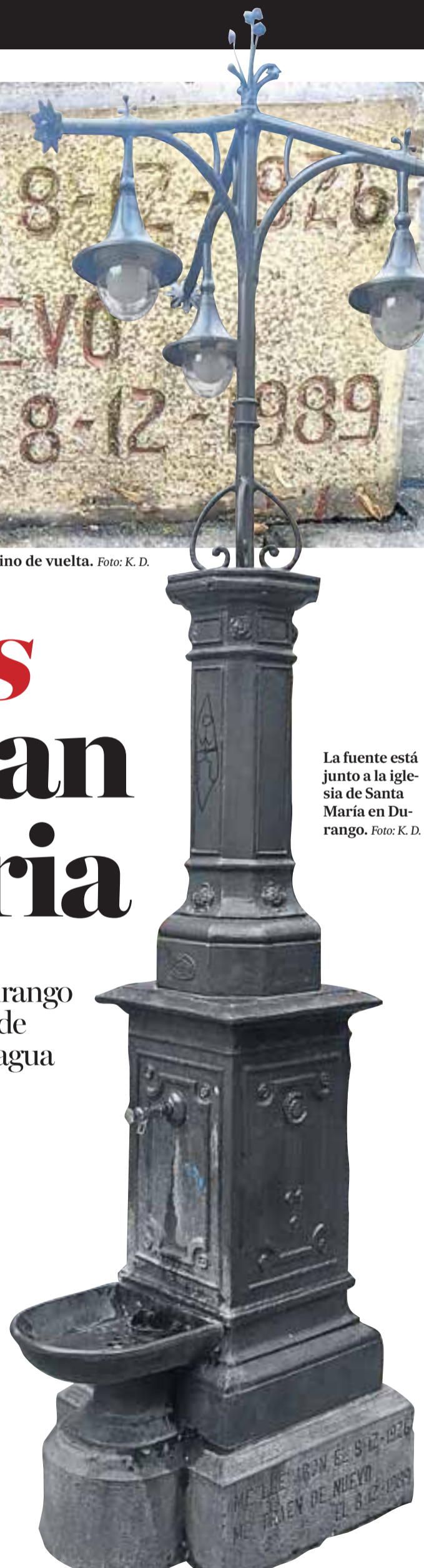
La fuente está junto a la iglesia de Santa María en Durango.

El diseño de esta insignia está formado por una bordadura granate que enmarca otra compuesta de cuadrados amarillos, granates y beiges. Dentro del estandarte se creó un gran cuadrado amarillo con un octógono granate que dibuja una estrella de 8 puntas en las que se van alternando el blanco y el rosa. El centro de la bandera está ocupado por un círculo blanco en que se incluye el año 1990 por un lado y por el otro el escudo de la anteiglesia de Durangaldea.