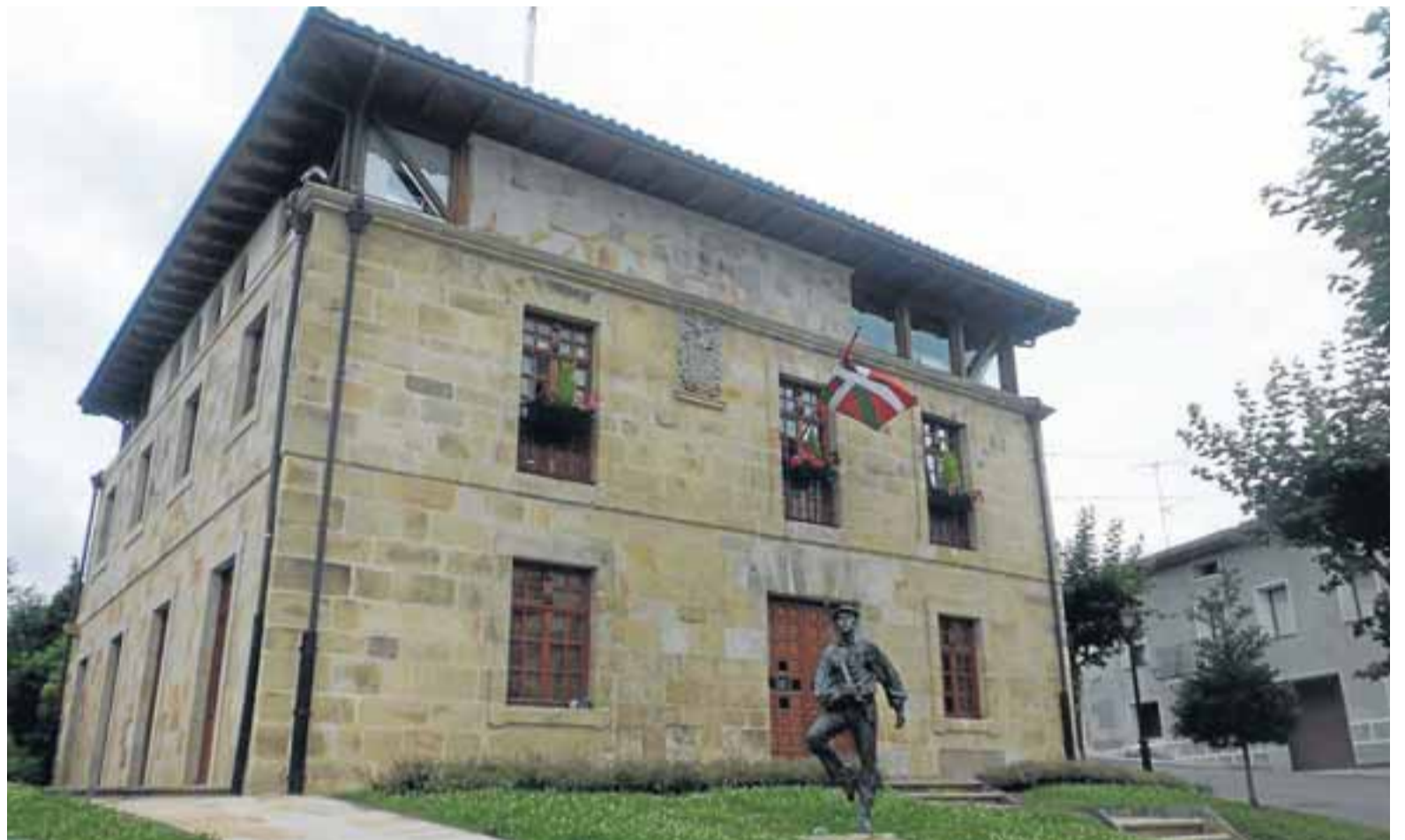
La casa consistorial de Iurreta es el escenario donde desde hace un cuarto de siglo se gestiona la vida diaria de la anteiglesia.

PASOS DEFINITIVOS Hubo que esperar al final del franquismo para que la llama de la independencia se encendiera entre los vecinos. Según el historiador iurretarra Jon Irazabal, en una conferencia pronunciada con motivo de los 20 años de Iurreta, “en marzo de 1978 se celebró una fiesta de la Juventud en Durango a la que acudimos varios