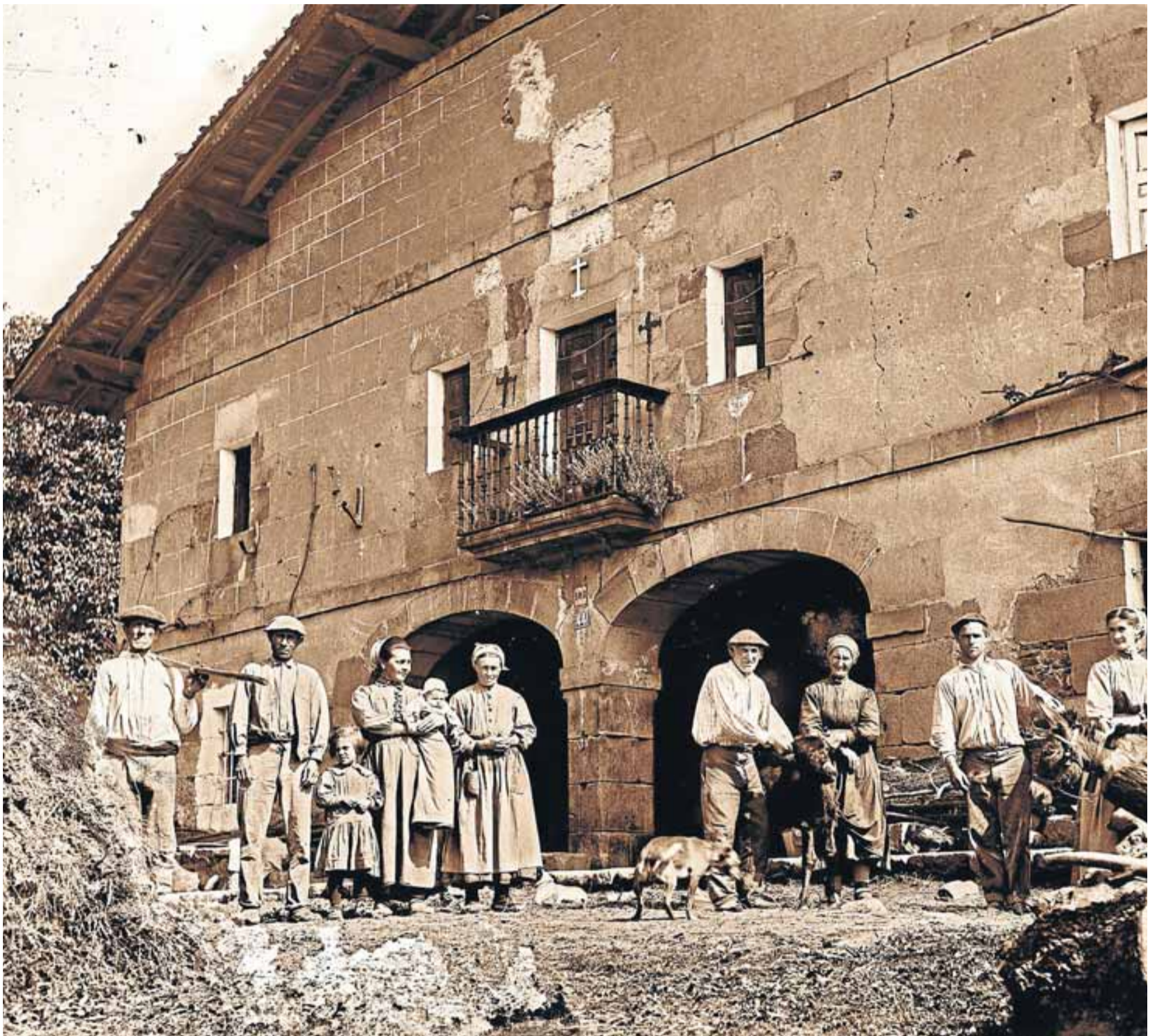
Gerediaga Elkartek hainbat argazki bildu ditu eta Iurretan ikus daitezke.